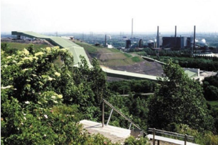
Bild 1: På Alpincenter i Tetraeder, Bottrop slingrar sig pisten likt en grön orm nedför den långa branten.

Alpincenter är byggt på en slagghög från kolbrytningen, typisk för ett gruvdistrikt i Ruhr-området. Skidbacken utnyttjar därmed den färdiga lutningen i branten. Den gröna färgen på anläggningen gör att byggnaden smälter bra in i miljön och blir inte så iögonfallande. Mellan entréområdet där biljettförsäljning sker, respektive där skidbacken slutar, går två från varandra separerade tunnlar som transporterar skidåkare och nykomna besökare högst upp till toppen. De två tunnarna på vardera 600 m har all tänkbar säkerhetsutrustning; rökdetektorer, rökridåer, nödbelysning och nödutgångar. Drift- och kontrollrum finns beläget i toppen av anläggningen.