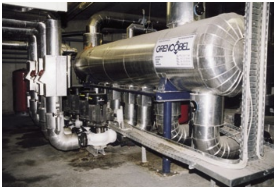
Bild 5: Rörsystemet i anläggningen innehåller 55 000 liter köldbärare.

Temper är till skillnad från glykol icke-toxisk, ekologisk och lätt nedbrytbar. Temper är dessutom varken brandfarlig eller explosiv och klassas i Tyskland som WGK 1 (Wassergefährdungsklasse). Om ett läckage skulle uppstå utgör Temper ingen skada för miljön då den är helt nedbrytbar i naturen efter sju dagar.