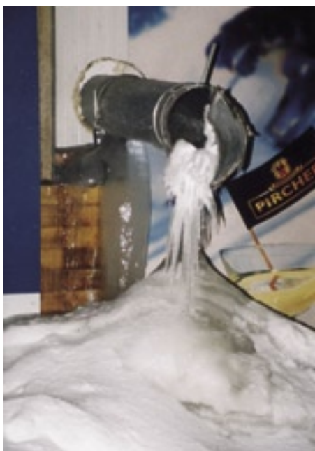
Bild 4: Pulveriserad is blåses ut i skidbacken och omvandlas till snö.

Optimalt korrosionsskydd uppnås i Temper genom speciella tillsatser. Tack vare att viskositeten är så låg jämfört med glykol kan pumpar och rörledningar ha mindre dimensioner för att uppnå samma prestanda. Detta sänker kostnaderna för anskaffning, installation och drift av systemet.