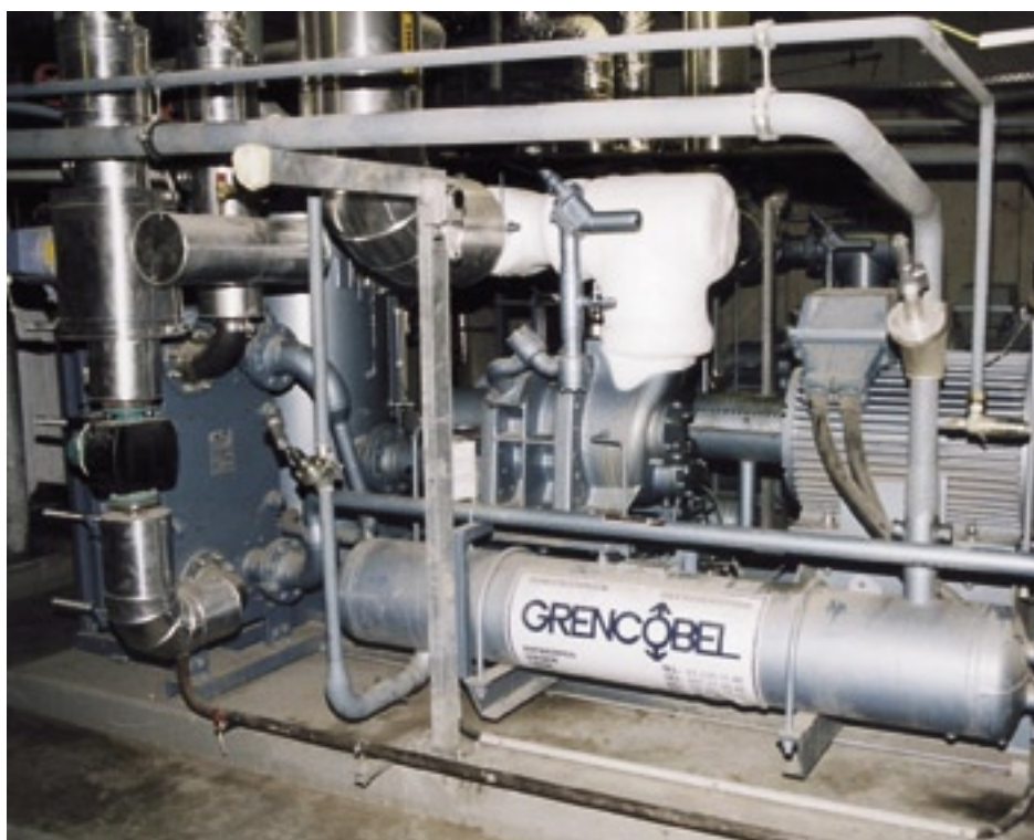
Bild 6: Två ammoniak kompressorer med en total kyleffekt av 1,4 MW förser skidanläggningen med kyla.

till friskluftskylningen är det nödvändiga luftutbytet.